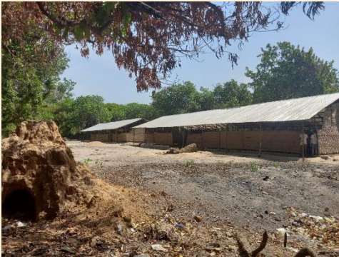
Foto del 2022 della esistente scuola di Cacheu fatta con pareti in stuoia che nel periodo delle piogge venivano spazzate via.