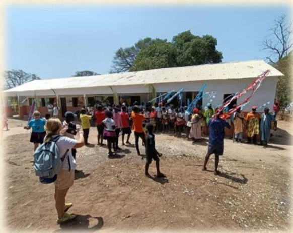
Foto inaugurazione marzo 2024

collegato da un bel porticato frontale molto utile per ripararsi durante la stagione delle piogge. Nel costo complessivo del progetto (circa 18.000 euro) è stato inserito anche l'acquisto di un grosso motocarro a tre ruote, mezzo molto in uso in Guinea Bissau sia per trasportare persone e materiale, che nel contesto dell'isola di Canogo è risultato l'unico mezzo di trasporto di tutto il materiale da costruzione necessario per la scuola, proveniente a mezzo barcone direttamente dalla capitale Bissau.